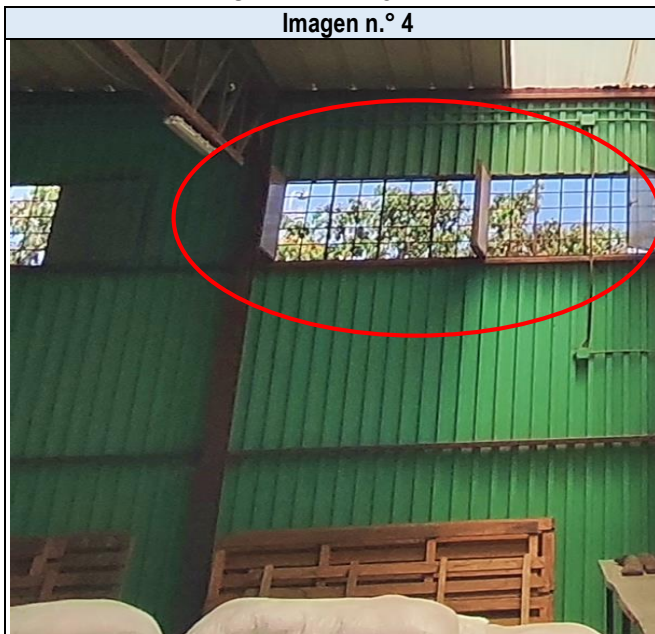
Imagen n.º 4

Descripción: Se aprecia que las ventanas del almacén del PVL no cuentan con mecanismos que protejan los productos alimenticios de contaminación externa.