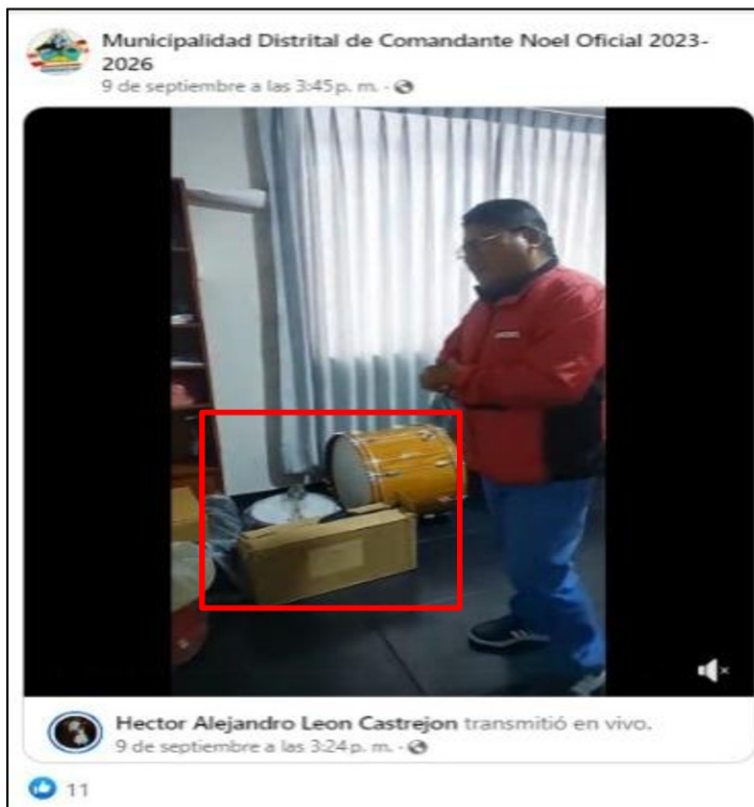
IMAGEN N° 1 PUBLICACIÓN DE DECLARACIÓN DEL ALCALDE DE LA ENTIDAD