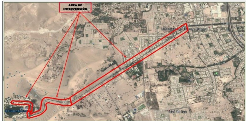
Imagen N° 1 Captura del orden de prelación consignado en la cartera PMI