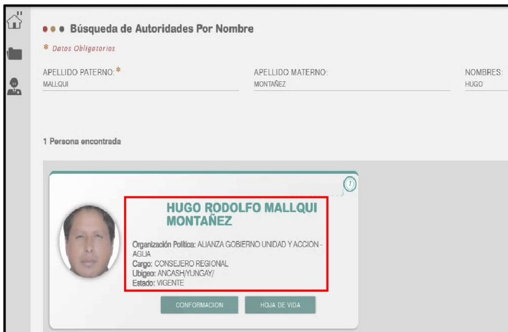
IMAGEN N° 2 CONSULTA DEL CARGO DE CONSEJERO REGIONAL EN LA PAGINA WEB DEL JNE