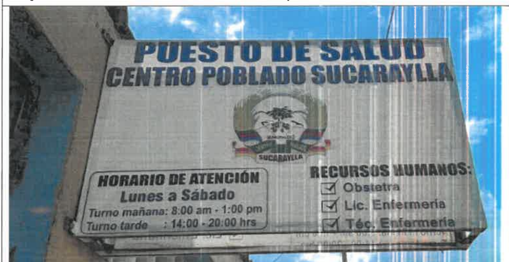
Imagen N° 1: Horario de atención del EESS de Sucaraylla