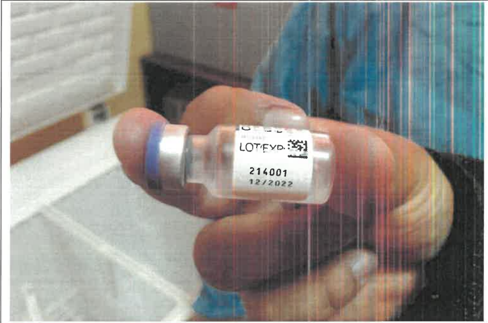
Imagen N° 4: Vacunas contra la COVID-19 en el Establecimiento de Salud de Sucaraylla se encuentran vencidas desde diciembre de 2022.