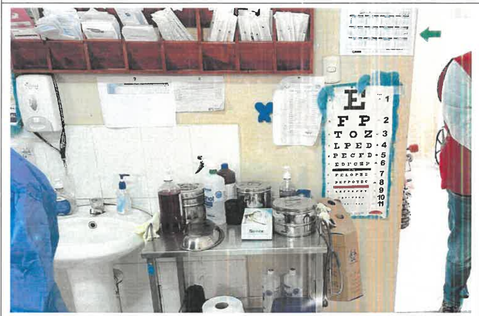
Imagen N° 3: Ambiente destinado para actividades de vacunación en el Establecimiento de Salud de Sucaraylla (compartido con enfermería).