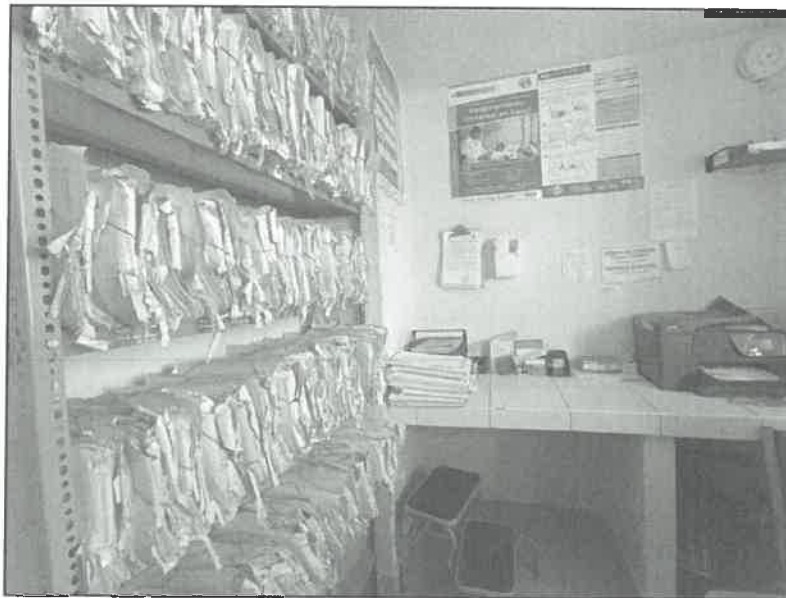
Imagen n.° 03 Zona de Admisión compartida con triaje.

Fuente: Acervo fotográfico de la Comisión de Control. Elaborado por: Comisión de Control.