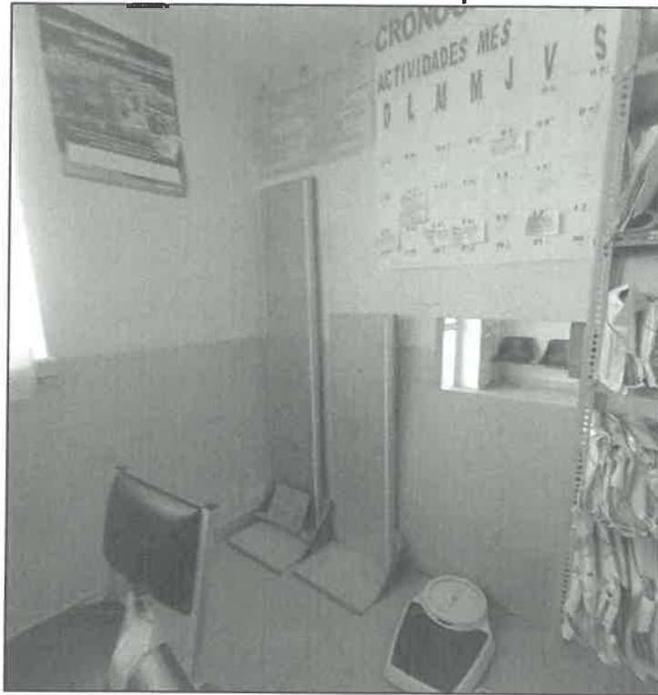
Imagen n.º 02 Zona de Admisión sin ambientes complementarios.