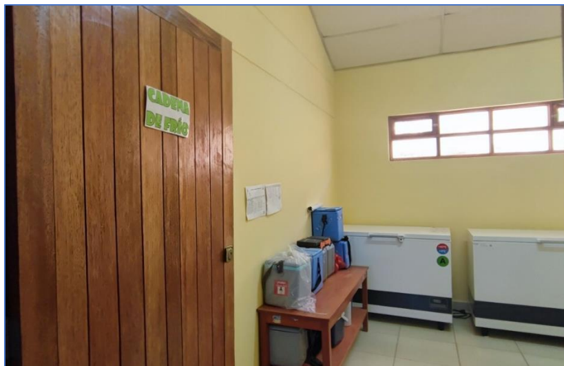
Fotografía n.º 3 Ambiente de Cadena de frío