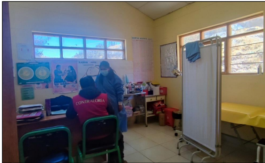
Fotografía n.º 1 Ambiente compartido donde realizan la aplicación de vacunas

Fuente: Visita de control realizada el 4 de setiembre de 2023 Elaborado por: Comisión de Control