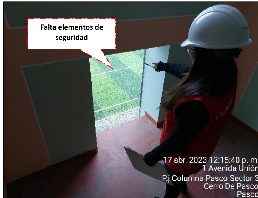
Imagen n.º 12 Falta de elementos de seguridad en el descanso de la escalera