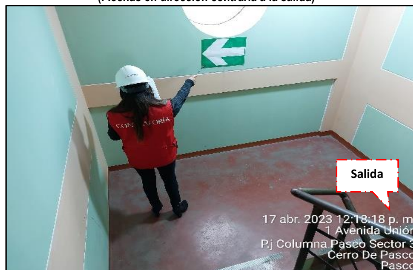
Imagen n.º 11 Deficiencias en señalización (Flechas en dirección contraria a la salida)