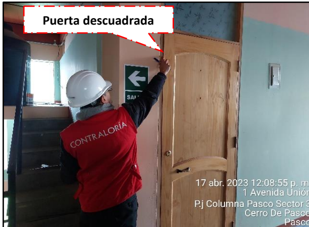
Imagen n.ºs 6 y 7 Puertas y ventanas