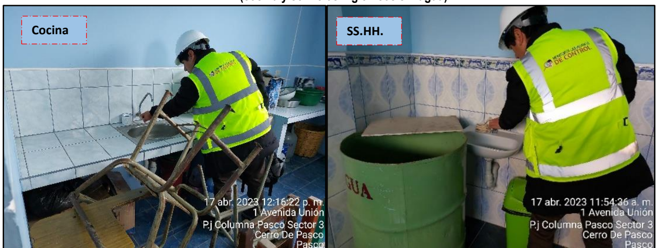
Imagen n.ºs 2 y 3 Red de agua (cocina y servicios higiénicos sin agua).

Fuente: Reporte de Monitor Ciudadano de Control del 17 de abril de 2023.