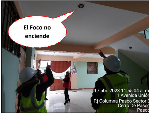
Imagen n.ºs 4 y 5 Red eléctrica