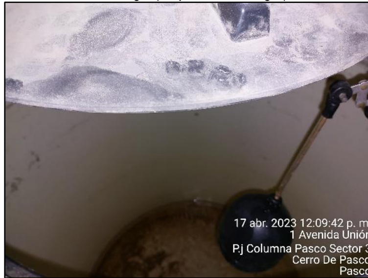
Imagen n.º1 Red de agua (tanque elevado sin agua).