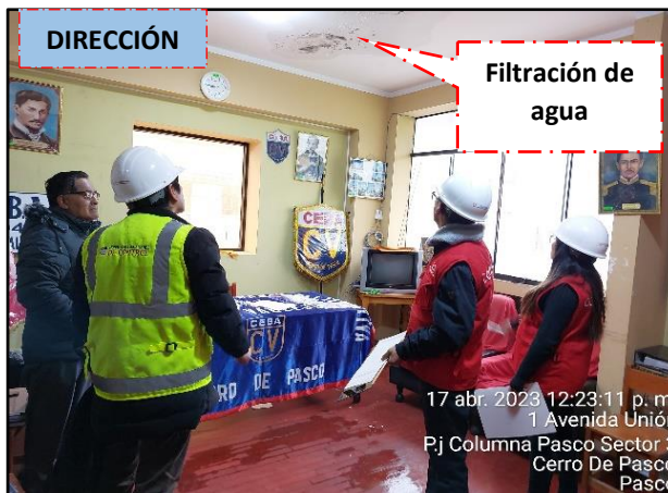
Imagen n.ºs 8 y 9 Cubierta