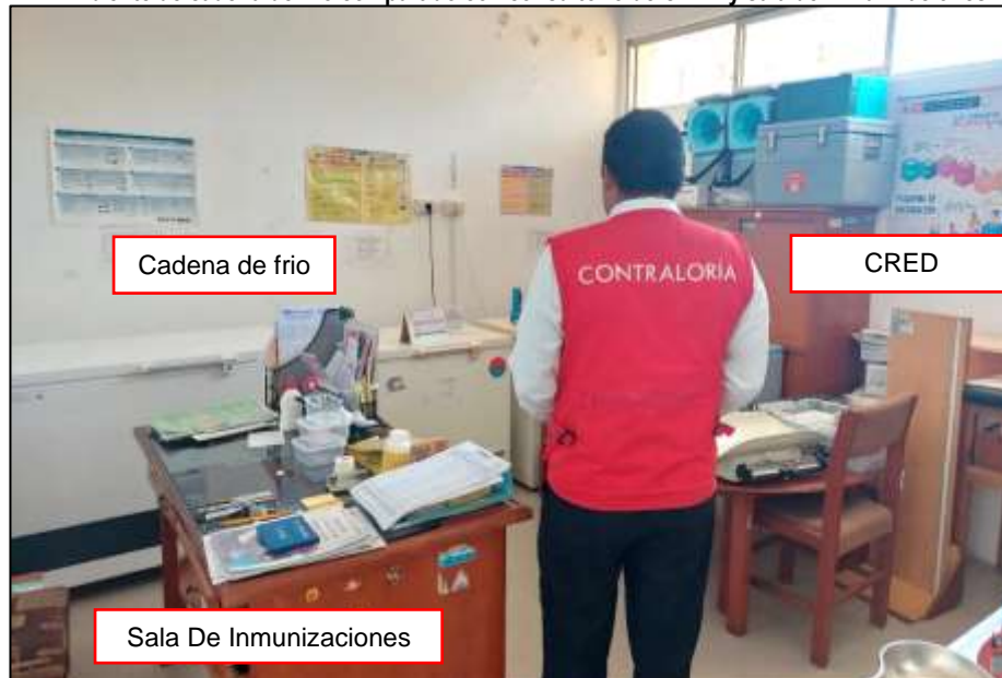
Imagen n.º 7 Ambiente de cadena de frio compartido con consultorio de CRED y sala de inmunizaciones

Cabe precisar que esta situación genera el riesgo de que haya accidentes en el ambiente de cadena de frio y esto genere la perdida de vacunas, debido a que diversas personas ingresan en el ambiente.