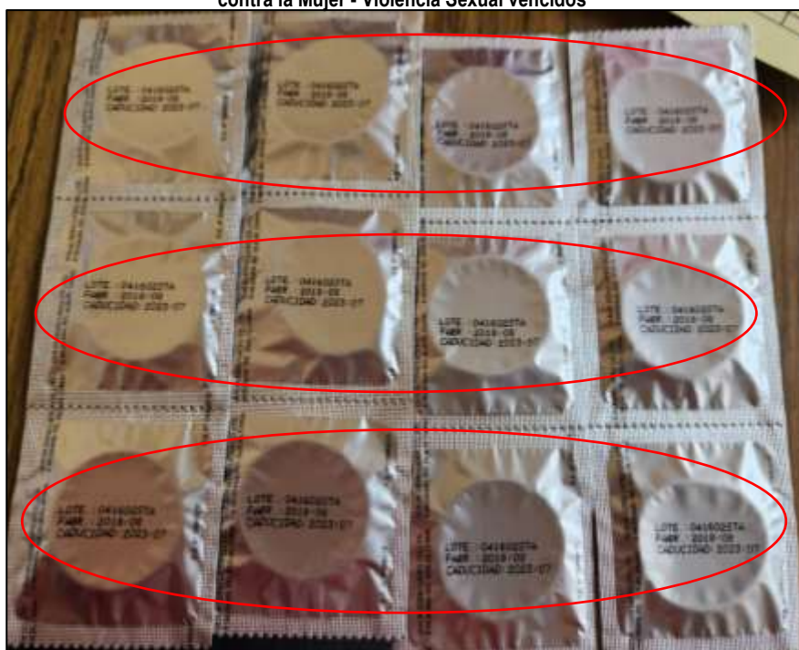
Imagen n.° 1 Puesto de Salud Bocapan Preservativos del Kit de Atención de Casos de Violencia contra la Mujer - Violencia Sexual vencidos

Al respecto, el kit de atención de casos de violencia contra la mujer – violencia sexual, forma parte del protocolo de atención de una víctima de violencia sexual, este kit deberá estar disponible en el servicio de emergencia o en el ambiente donde se brinda atención en el establecimiento de salud de primer nivel (tópico o consultorio), siendo de uso exclusivo para fines de atención de casos de violencia sexual, debiendo asegurar como mínimo, la disponibilidad física permanente de un kit en el ambiente antes indicado , debidamente rotulado en un lugar visible y de fácil acceso para su manejo cuando sea requerido, consideración que el Puesto de Salud Bocapan no cumple, tal como se demuestra en la siguiente imagen: