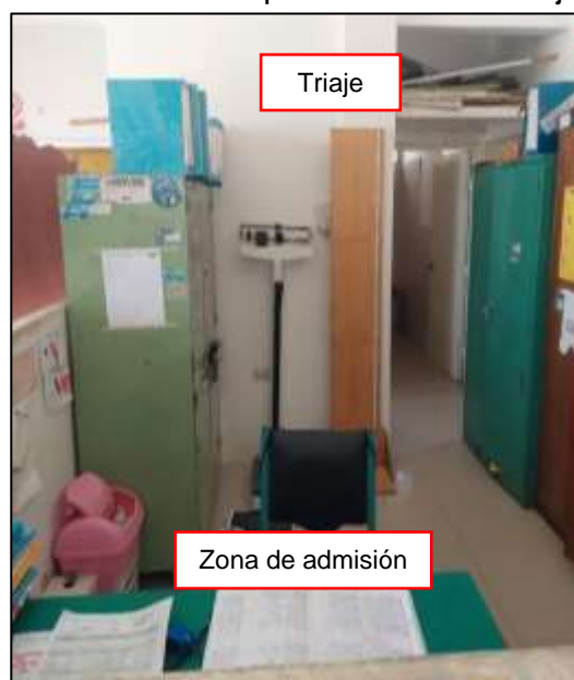
Imagen n.º 8 Zona de admisión compartida con ambiente de Triage

A través de la aplicación del formato antes citado, se advierte que el Establecimiento de Salud cuenta con un ambiente de Triage la cual es compartida con la zona de admisión, tal como se muestra en la siguiente imagen: