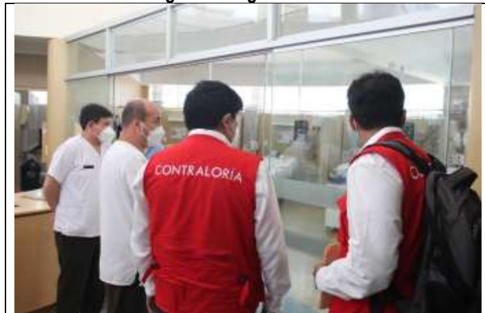
Servicio de Emergencia del HMC: En la Sala de Observación de la presente UPSS se advierte la ausencia del sistema de llamado paciente – enfermera.