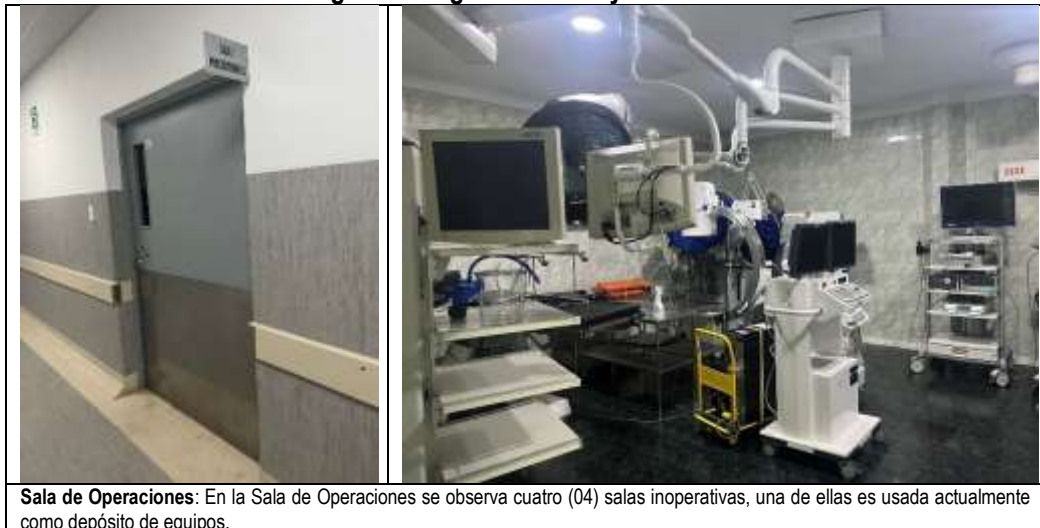
Sala de Operaciones: En la Sala de Operaciones se observa cuatro (04) salas inoperativas, una de ellas es usada actualmente como depósito de equipos.