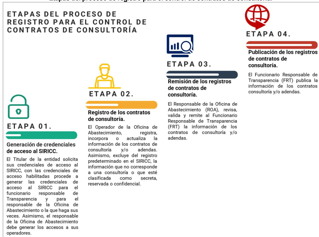
Gráfico n.º 1 Etapas del proceso de registro para el control de contratos de consultoría.