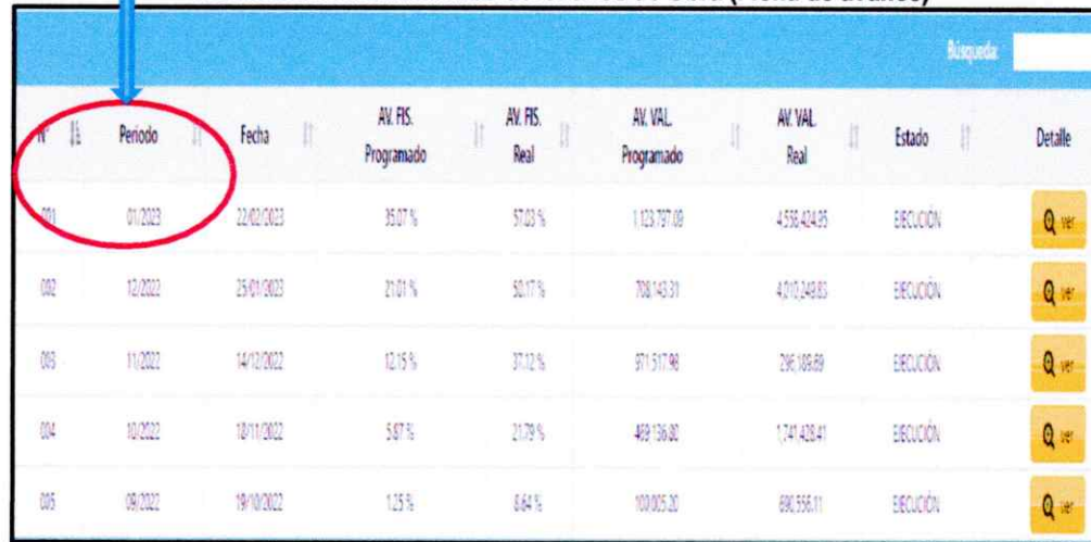
Imagen n.º 4 Información desactualizada del avance de Obra (Ficha de avance)