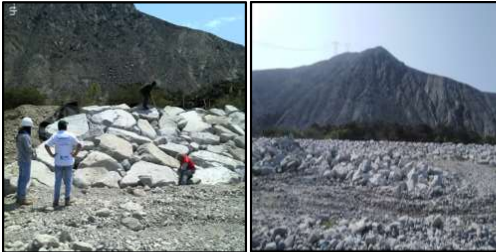
Fuente: Acta de inspección física de los días 25 de agosto, 4 y 5 de setiembre de 2023.

Por otra parte, de la documentación recibida por parte de la Autoridad para la Reconstrucción con Cambios, se tiene los tramos de intervención de la empresa OHLA, donde se destaca en el Resumen Ejecutivo sector 4 – Río Grande (400198-OHL001-502-XX-DM-ZZ-100001), en el Ítem IV. Objetivos y Justificación del Proyecto Integral Casma y del Sector 4 Río Grande del, se indica: