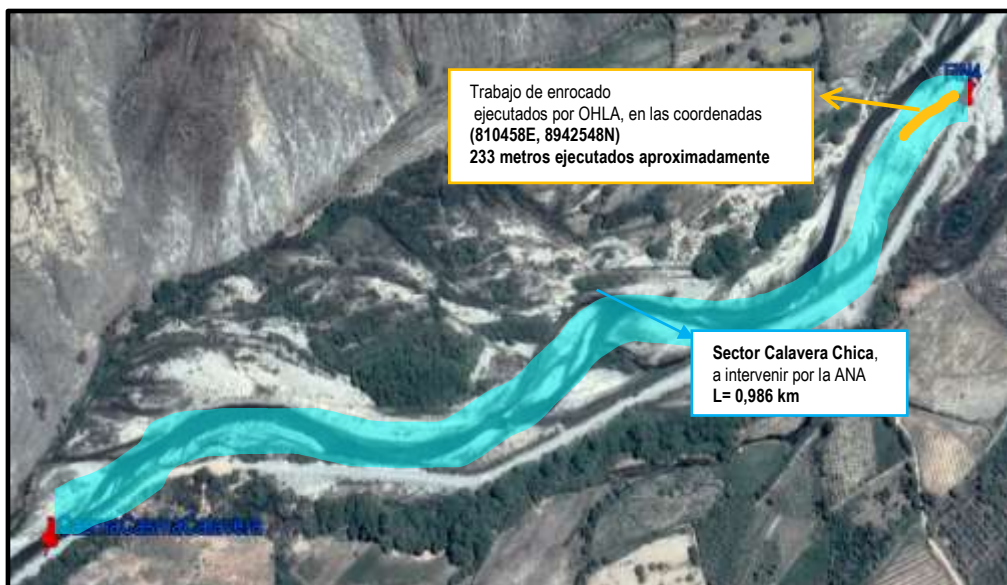
IMAGEN N° 7 IMAGEN DEL GOOGLE EARTH, REPRESENTANDO LA INTERVENCION DE LA EMPRESA OHLA EN EL SECTOR CALAVERA CHICA