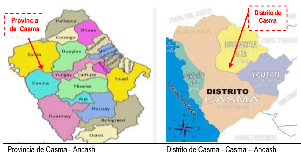
IMAGEN N° 2 UBICACIÓN POLÍTICA DEL SERVICIO