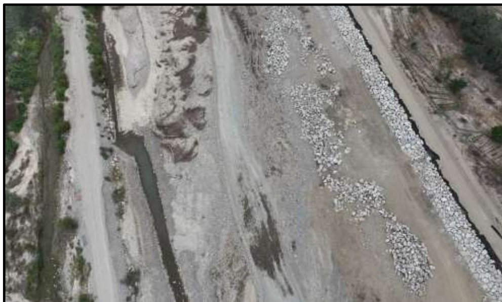
FOTOGRAFÍA N° 5 SE MUESTRA IMÁGENES CAPTADAS POR EL DRON, DONDE SE ADVIERTE EL CAUCE DESCOLMATADO Y LA EJECUCIÓN DEL ENROCADO AL MARGEN DERECHO AGUAS ABAJO DEL RIO GRANDE