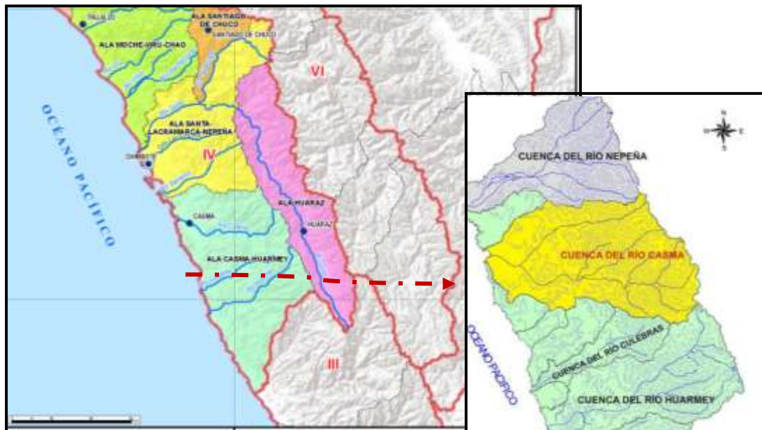
IMAGEN N° 1 ADMINISTRACIÓN LOCAL DEL AGUA HUARMEY CHICAMA – ALA SANTA – LACRAMARCA - NEPEÑA