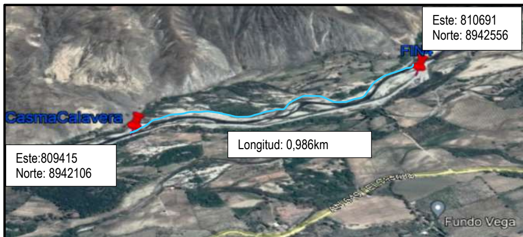
IMAGEN N° 3 VISTA SATELITAL DEL SECTOR CALAVERA CHICA