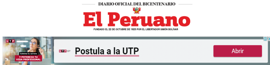
Imagen N.º 1 Publicación de Declaraciones Juradas en el Diario Oficial El Peruano