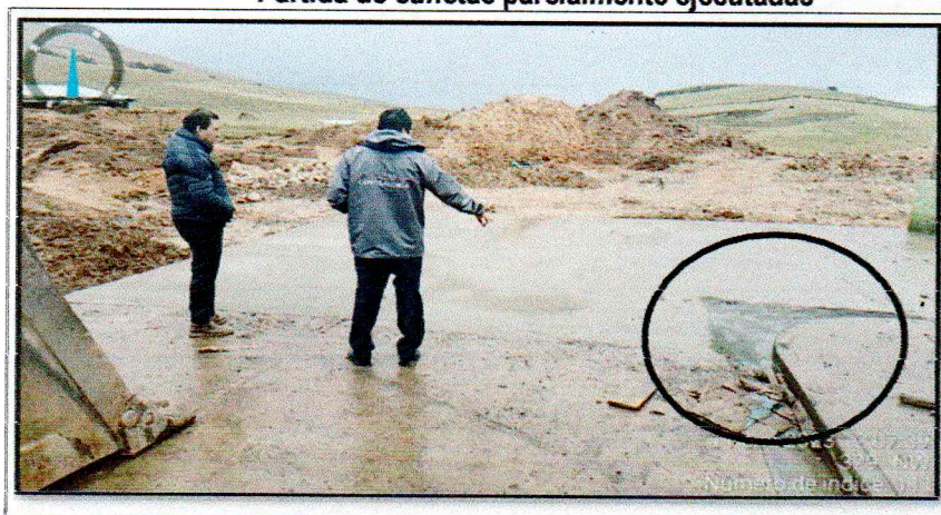
Imágenes n.º 1 Partida de cunetas parcialmente ejecutadas

Tales hechos se muestran en las siguientes imágenes: