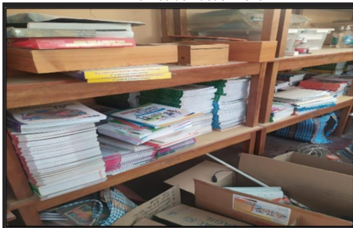
Vista fotográfica n.º 1 I.E. n.º 32753 de Pucuchinche