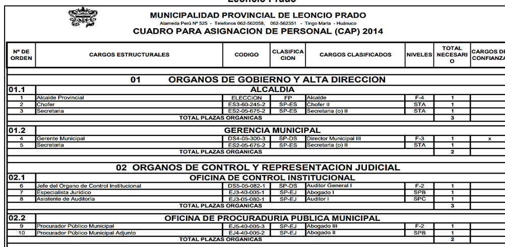
Imagen n.º 1 Cuadro para asignación de personal – CAP del periodo 2014 publicado en el portal institucional de la MP. Leoncio Prado