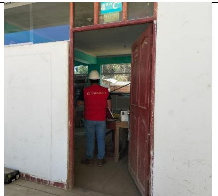
Imagen n.º 06: Vista donde se observa el acceso principal al área destinado como almacenamiento.