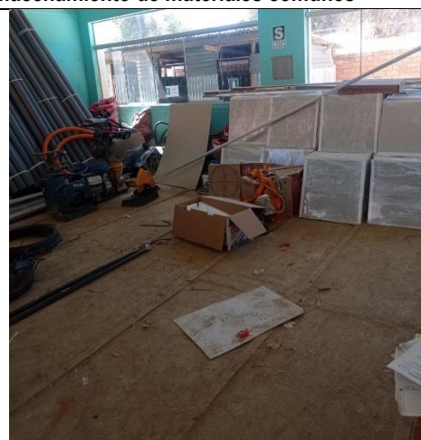
Imagen n.º 08: Vista donde se observa que el área de almacén carece de limpieza y orden que permita disponer de los materiales que sean requeridos.