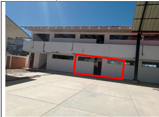
Imagen n.º 05: Vista donde se observa la parte frontal del área destinada para almacenamiento, el cual no tiene la identificación adecuada.