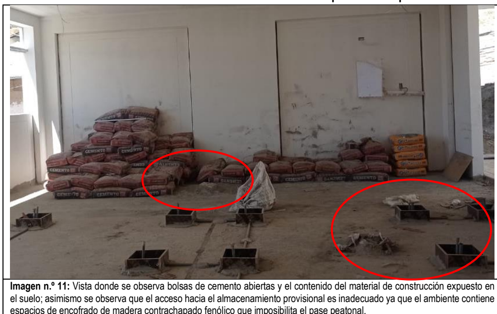
Imagen n.º 11 Deterioro de material común e inaccesibilidad para su manipulación