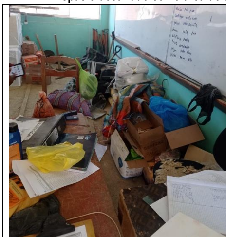
Imagen n.º 07: Vista donde se observa que al interior del área de almacenamiento no hay orden, y que los materiales obstruyen el libre acceso del personal y equipos