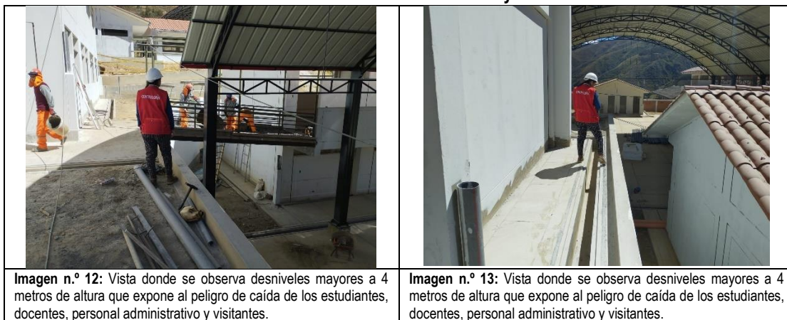
Imagen n.º 12: Vista donde se observa desniveles mayores a 4 metros de altura que expone al peligro de caída de los estudiantes, docentes, personal administrativo y visitantes.