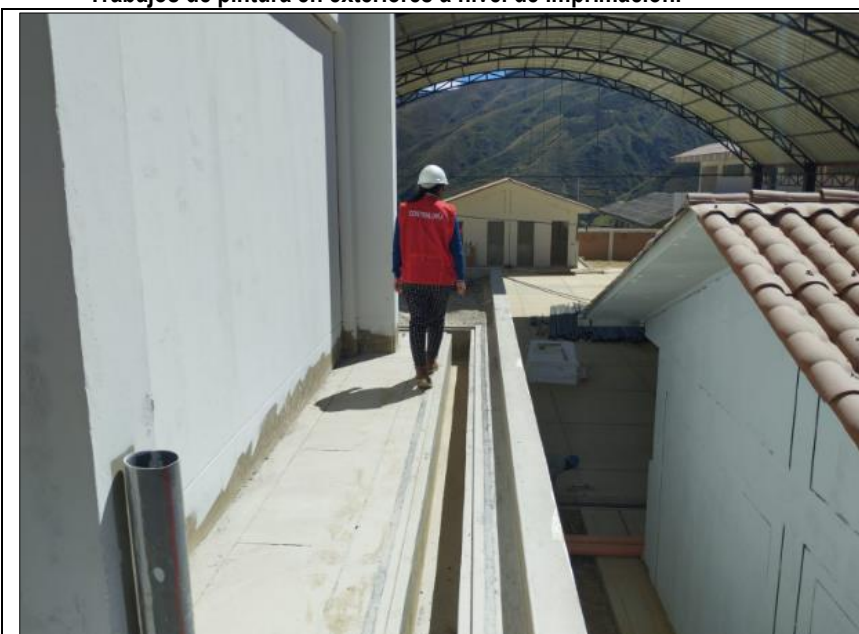
Imagen n.º 01: Vista donde se aprecia los trabajos de pintura en exteriores a nivel de imprimación en el módulo I y la escalera A