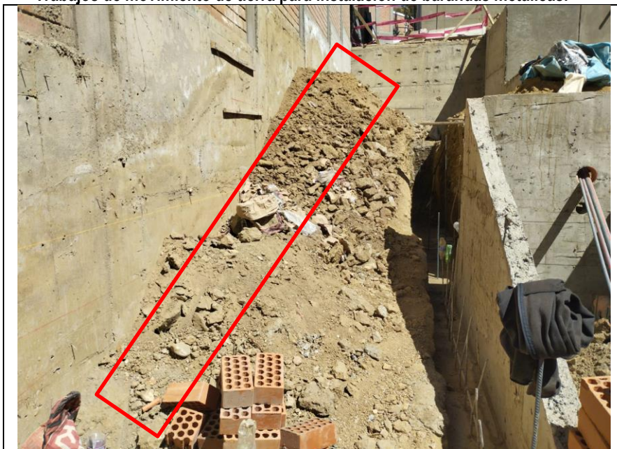
Imagen n.º 03: Vista donde se recomienda realizar las instalaciones de las barandas metálicas empotradas en el muro de contención, paralelo a la rampa 1.

Trabajos de movimiento de tierra para instalación de barandas metálicas.