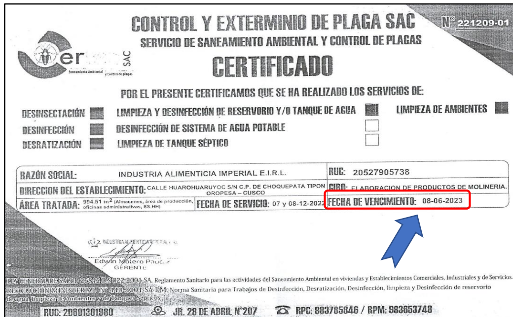
IMAGEN N° 6 CERTIFICADO DE SANEAMIENTO AMBIENTAL PRESENTADO EN OFERTA POR INDUSTRIA ALIMENTICIA IMPERIAL E.I.R.L.