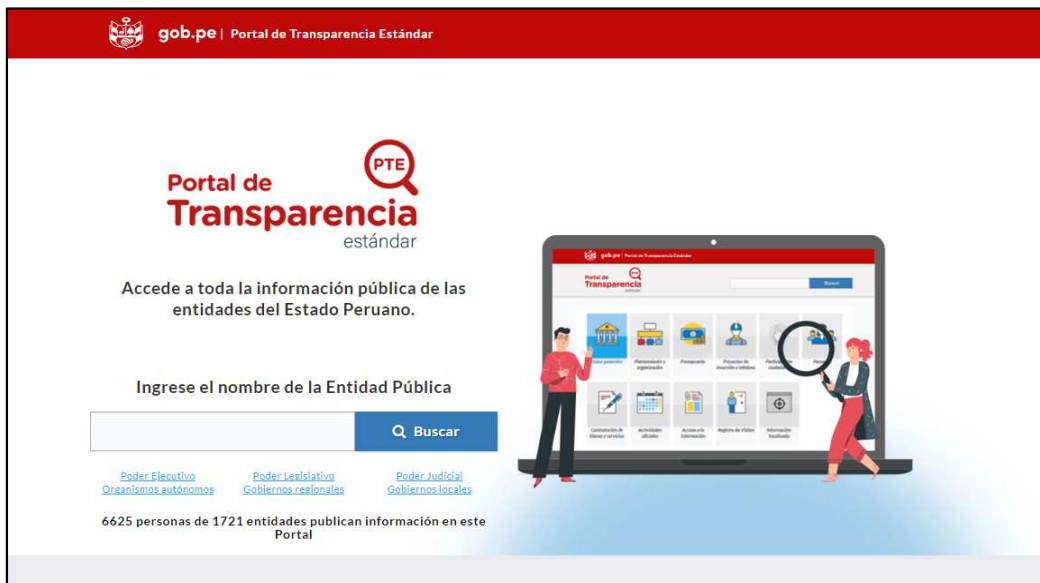
Imagen n.º 4 Consulta efectuada a la Plataforma Digital Única del Estado Peruano (Plataforma GOB.PE), respecto la ubicación del Portal de Transparencia Estándar – PTE de las entidades