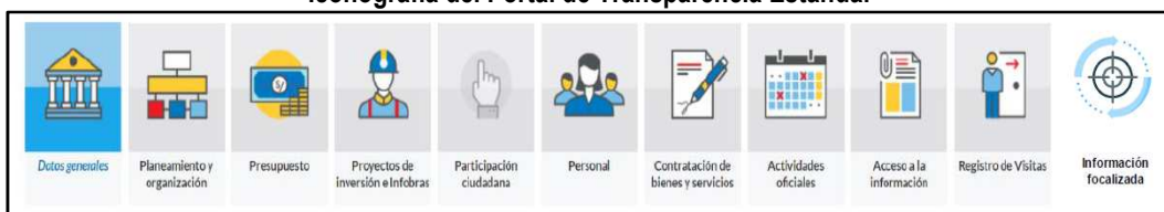
Imagen n.º 3 Iconografía del Portal de Transparencia Estándar