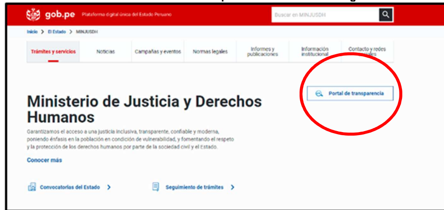
Imagen n.º 2 Ícono del Portal de Transparencia Estándar con logo