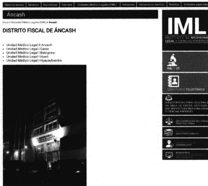
Fuente: Información publicada en el enlace https://www.mpfh.gob.pe/iml/dmls/

De la imagen precedente, se observa que la Unidad Médico Legal Áncash tiene nivel II. Asimismo, los documentos que emite la jefatura de la Unidad Médico Legal, y que han sido cursados a la comisión de auditoría también consigna en su encabezado lo siguiente: