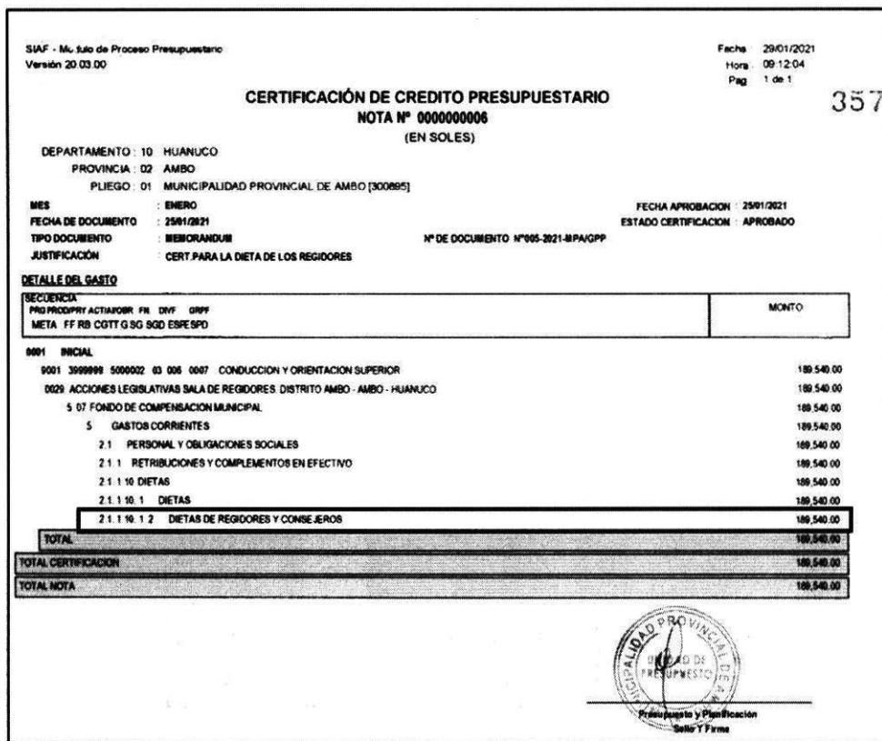
Imagen n.º 2 Certificación de crédito presupuestario – Nota n.º 000000006 (Apéndice n.º 26)

Fuente: Informe n.º 0017-2021-MPA-GPP/JKJG de 28 de enero de 2021 (Apéndice n.º 27)