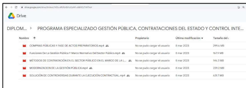
IMAGEN N° 5 DRIVE DE CARPETA "PROGRAMA ESPECIALIZADO GESTIÓN PÚBLICA, CONTRATACIONES DEL ESTADO Y CONTROL INTERNO" PROPORCIONADO POR CFOCAP

Fuente: https://drive.google.com/drive/folders/117aHMFA9KShGqZnlX9prwxcbE0AKssw?usp=share_link .