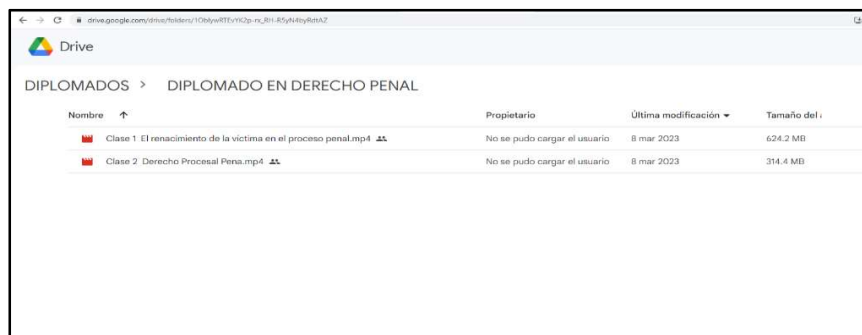
IMAGEN N° 4 DRIVE DE CARPETA "DIPLOMADO EN DERECHO PENAL" PROPORCIONADO POR CFOCAP