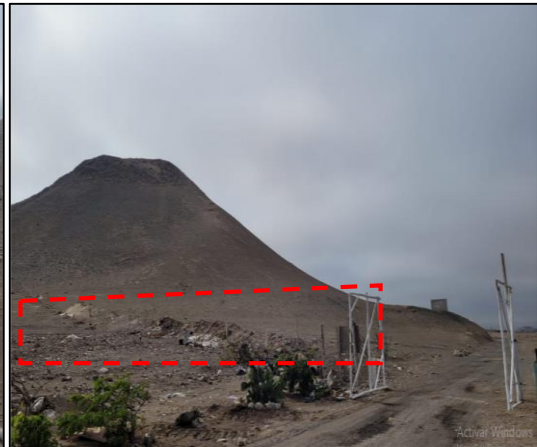
Se encontró algunos palos plantados, otros inclinados y en algunos casos solo huellas de la delimitación del área del botadero por el lado izquierdo, por lo que no garantiza seguridad.