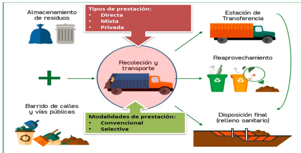
FIGURA N° 1: ANÁLISIS DEL PROCESO DEL SERVICIO DE LIMPIEZA PÚBLICA