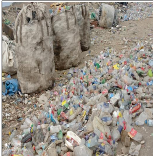
Se encontró botellas descartables en el suelo y otros llenados en costales.