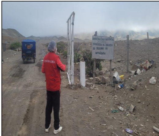
En el ingreso al botadero municipal la puerta de madera abierto, no existe control de ingreso y salidas de personas