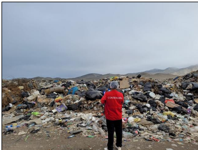
Los residuos sólidos están expuestos al aire libre