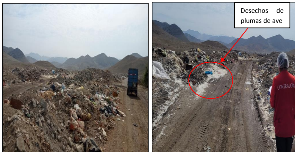
FOTOGRAFÍAS N.ºS 7 Y 8 PUNTO CRÍTICO N.º 1: INGRESO POR URBANIZACIÓN NERY

Se encontró residuos sólidos de plumas de aves y desechos de demolición de construcción