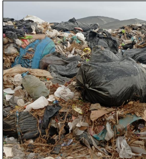
Los residuos sólidos no están compactados