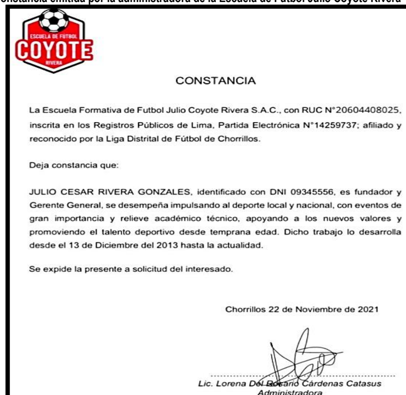
Imagen n.º 1 Constancia emitida por la administradora de la Escuela de Fútbol Julio Coyote Rivera