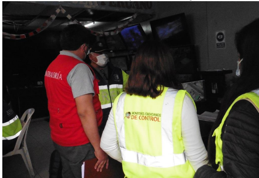
Imagen n.º 10 Visita al centro de monitoreo y control de videovigilancia.