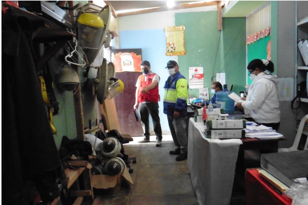
Fuente: Inspección física a cargo de la comisión de control de 22 de octubre de 2021.