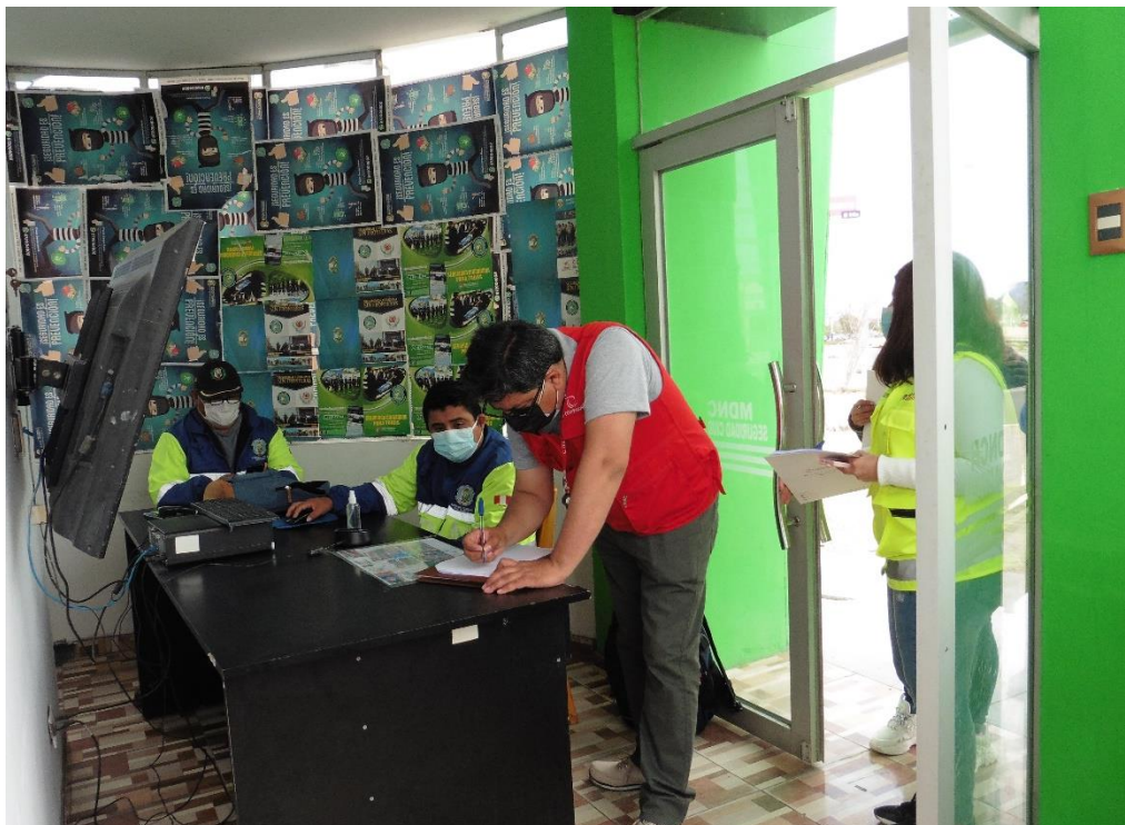
Imagen n.º 12 Visita al módulo de monitoreo y control de videovigilancia ubicado en Las Américas – Nuevo Chimbote.