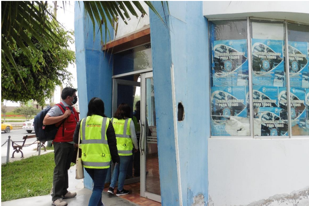
Imagen n.º 11 Visita al módulo de monitoreo y control de videovigilancia ubicado en el óvalo La familia – Nuevo Chimbote.