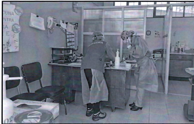
IMAGEN N.º 1 HALL Y RECEPCIÓN DEL CONSULTORIO DE VACUNACIÓN.

Asimismo, los ambientes de hall y recepción y área climatizada no cuentan con extintor contra incendios de polvo químico seco 12 Kg. o 30 Lb. aproximadamente, conforme lo indica el Anexo n.º 27, de la Norma Técnica de Salud NTS N° 110 – MINSA/DGIEM-V.01 “Infraestructura y Equipamiento de los Establecimientos de Salud del Segundo Nivel de Atención”.