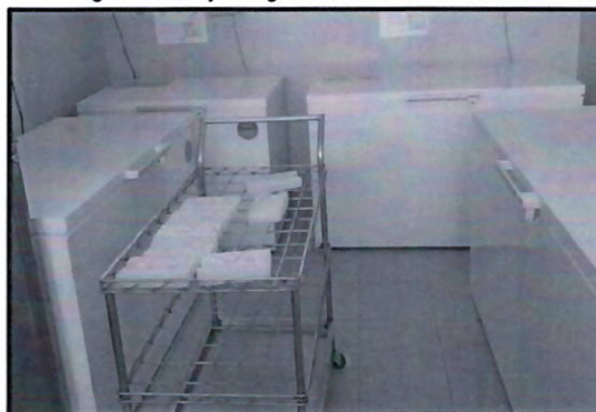
Refrigeradoras y congeladoras de Cadena de frío