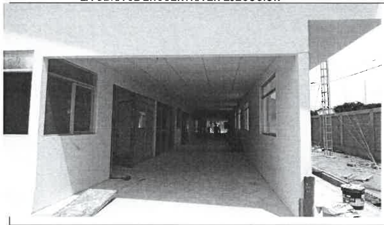
FOTOGRAFÍA N° 1 LA OBRA SE ENCUENTRA EN EJECUCIÓN