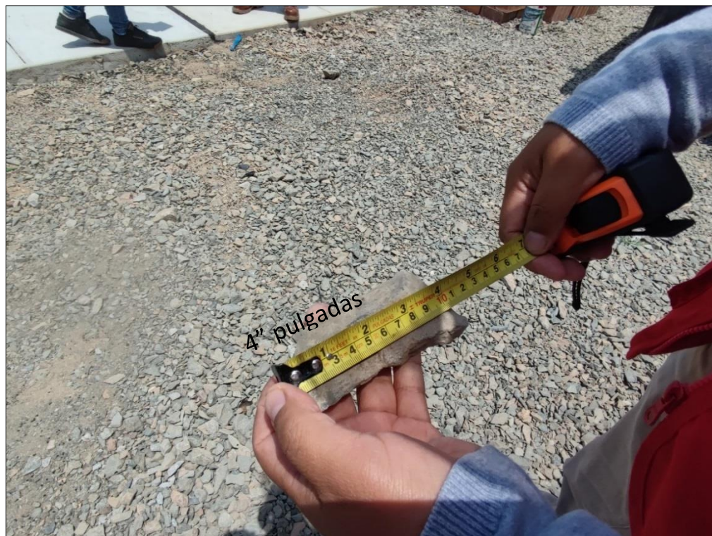
Fuente: Acta de verificación física n.° 002-2021-CG/GRAN-OCI-MPH-CC-0, del 15 de octubre de 2021 Elaborado por: Comisión de Control