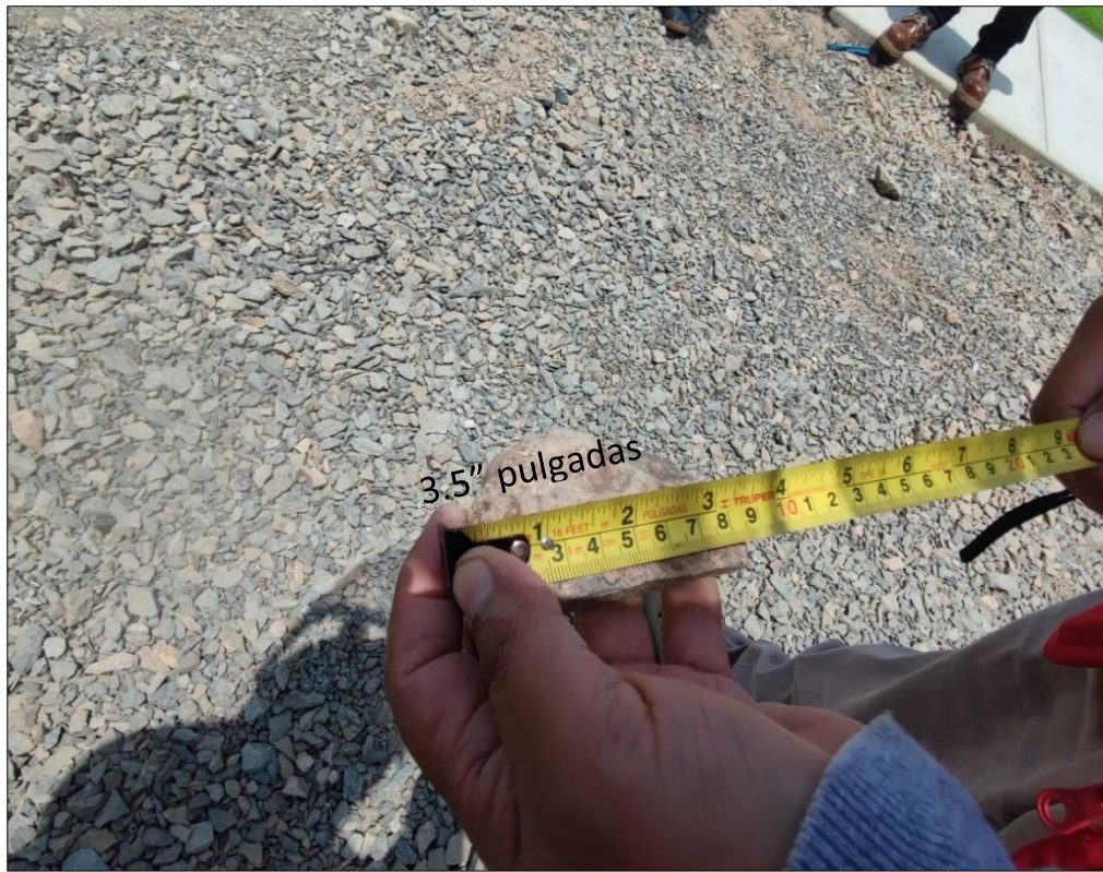
Fuente: Acta de verificación física n.° 002-2021-CG/GRAN-OCI-MPH-CC-0, del 15 de octubre de 2021 Elaborado por: Comisión de Control