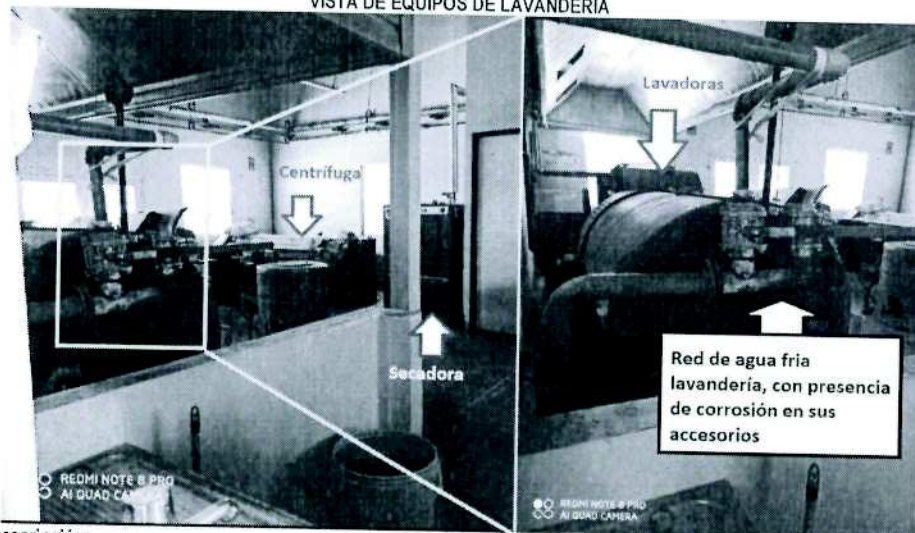
FOTOGRAFÍA N° 1 VISTA DE EQUIPOS DE LAVANDERÍA

Se visualiza accesorios deteriorados con presencia de corrosión y la ubicación de los equipos del área de lavandería en el Ex Hospital de Contingencia.