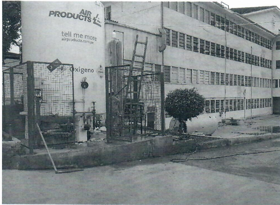
Imagen n.º 4 Exteriores del área de Emergencia

Leyenda: En la imagen se observa el área donde se encuentra ubicado la central de oxígeno del Hospital Regional; siendo que, en el marco de la presente vista de control al Hospital Regional, se advirtió que cuenta con un área de 15.12 m 2 .