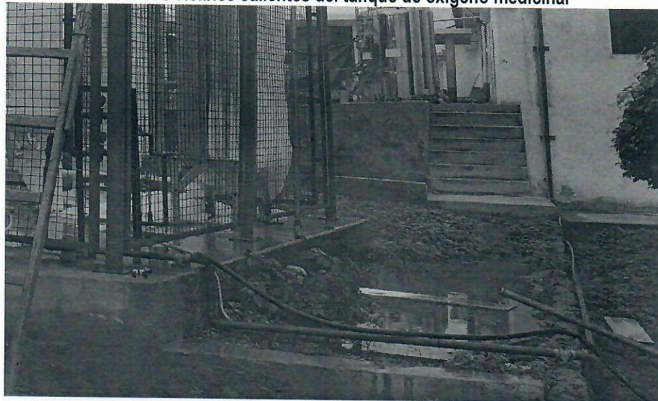
Imagen n.º 3 Tuberías visibles salientes del tanque de oxígeno medicinal

Leyenda: En la imagen se observa que del tanque de oxígeno instalado en el Hospital Regional salen diversas tuberías las cuales gran parte de ellas se encuentran despintadas.