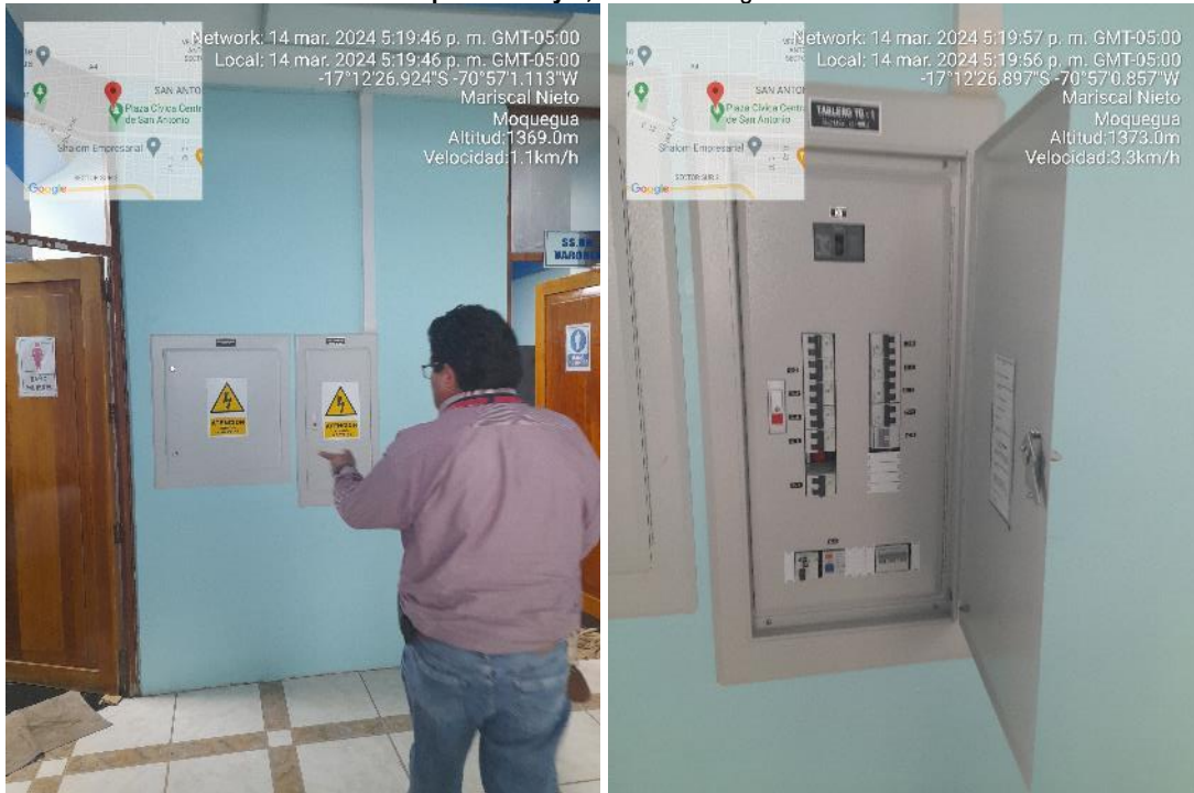
Imagen 16 Componente 1 y 2, Vista tablero general.

Fuente: Inspección Física n.º 005-2024-OCI/MPMN-SCC-H1 de 14 de marzo de 2024 Elaboración: Comisión de Control