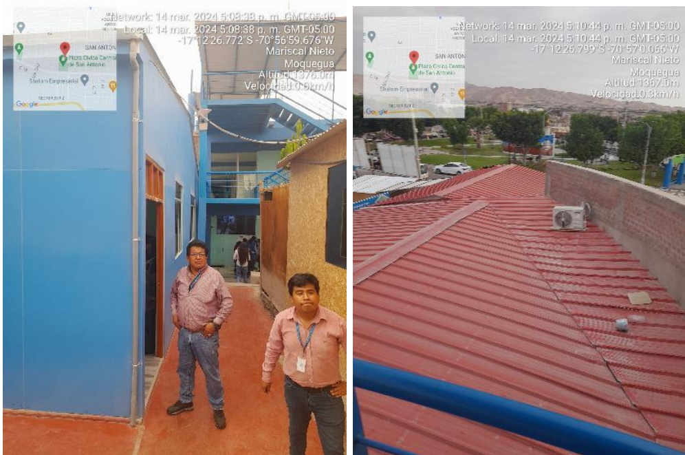
Imagen10 Componente 1, Vista de auditorio..