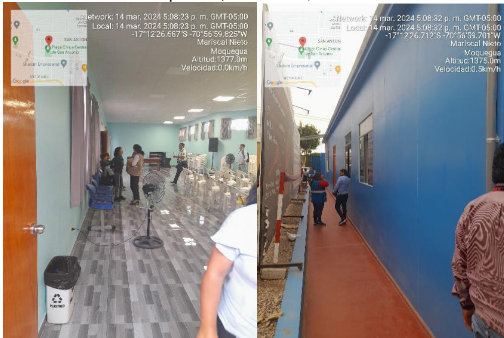
Fuente: Inspección Física n.º 005-2024-OCI/MPMN-SCC-H1 de 14 de marzo de 2024 Elaboración: Comisión de Control