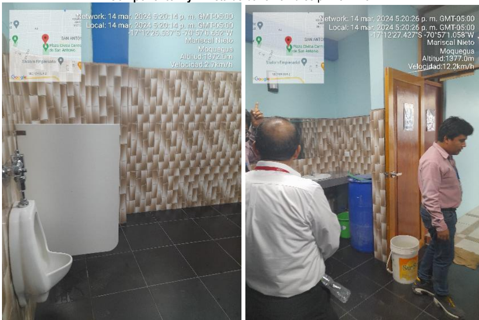
Fuente: Inspección Física n.º 005-2024-OCI/MPMN-SCC-H1 de 14 de marzo de 2024 Elaboración: Comisión de Control