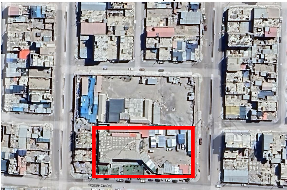
Imagen n. ° 1 Ubicación del proyecto