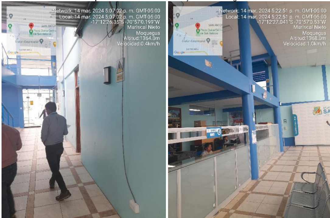
Imagen 17 Componente 2 Vista de luminarias y luces de emergencia

Fuente: Inspección Física n.º 005-2024-OCI/MPMN-SCC-H1 de 14 de marzo de 2024 Elaboración: Comisión de Control