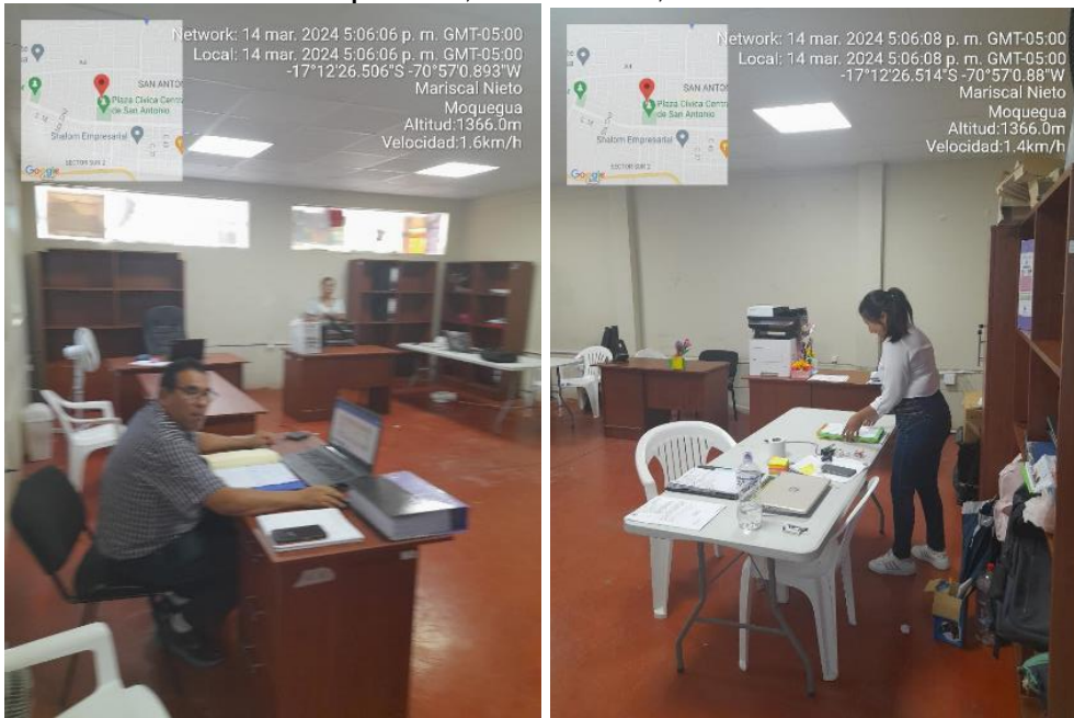
Fuente: Inspección Física n.º 005-2024-OCI/MPMN-SCC-H1 de 14 de marzo de 2024 Elaboración: Comisión de Control