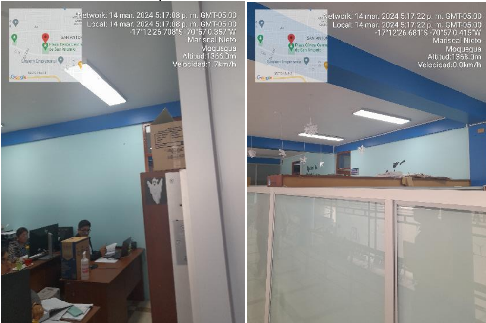
Imagen 11 Componente 2 Vista de luminarias cambiadas