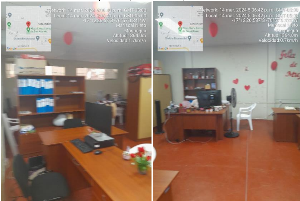
Fuente: Inspección Física n.º 005-2024-OCI/MPMN-SCC-H1 de 14 de marzo de 2024 Elaboración: Comisión de Control