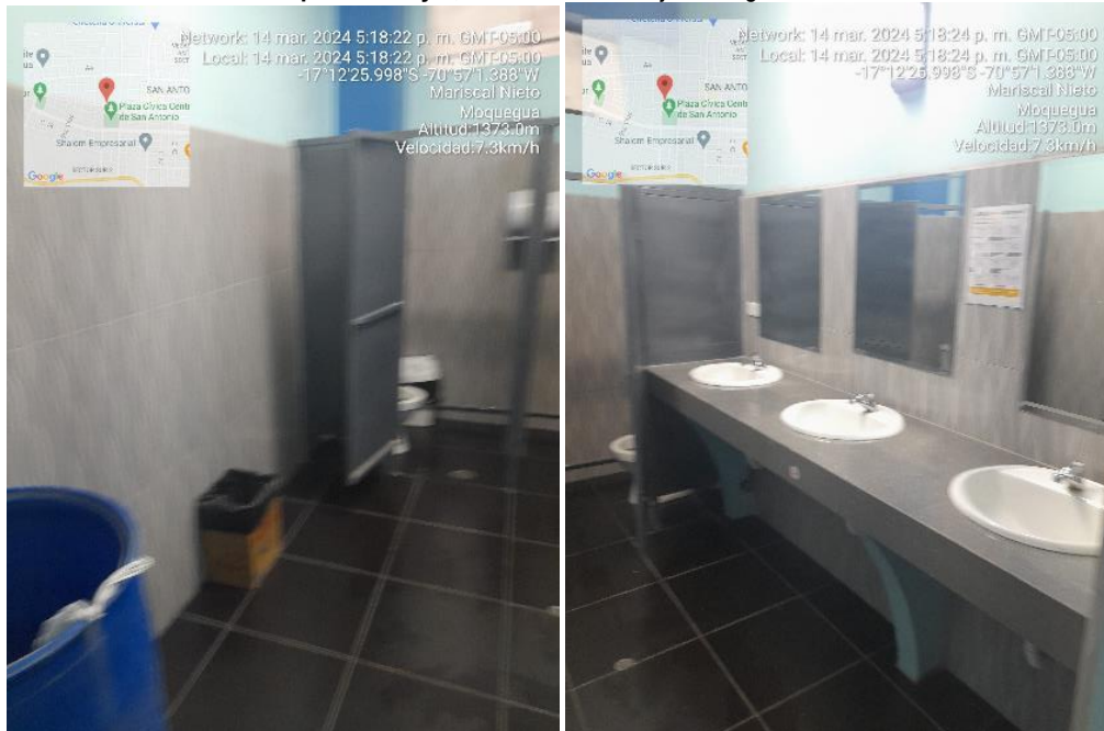
Imagen 13 Componente 1 y 2, Vista de baño mujeres segundo nivel.