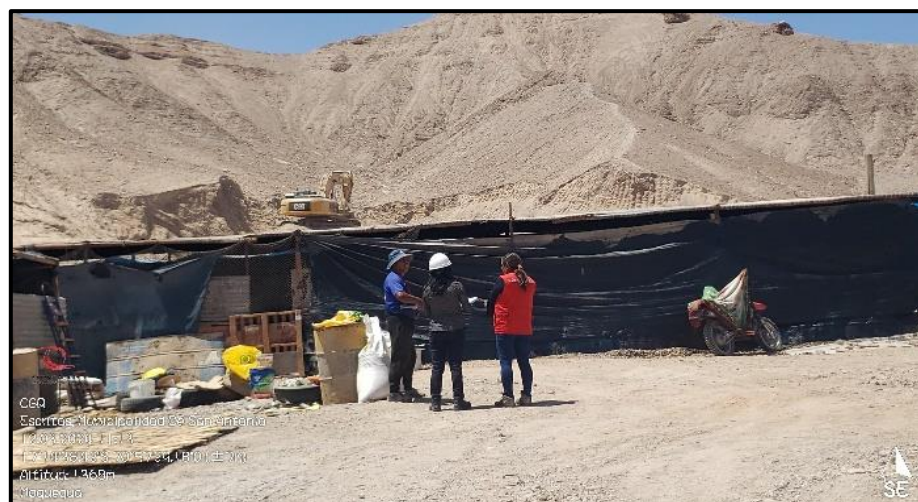
Fuente: Acta de recopilación de información N° 001-2024 de 12 de marzo de 2024.

Se consultó al residente e inspector sobre los documentos o autorizaciones necesarias para el uso y extracción del material, quien mencionó que se cuenta con un acta de