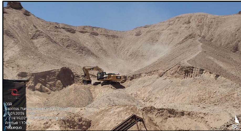
Fuente: Acta de visita de inspección física n.º 001-2023 -OCI/MPMN-CC-H1 de 15 de marzo de 2024.