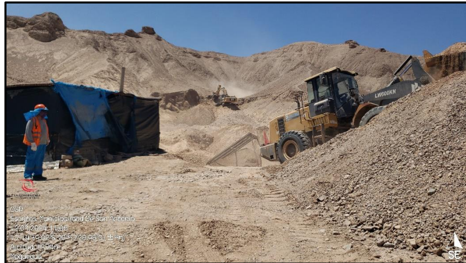
Fuente: Acta de visita de inspección física n.º 001-2023 -OCI/MPMN-CC-H1 de 15 de marzo de 2024.