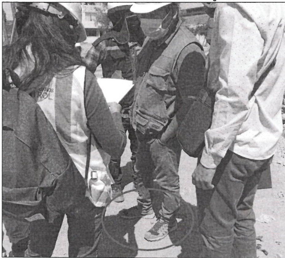
Imagen n.º 3 Asistente del residente de Obra sin calzado de seguridad